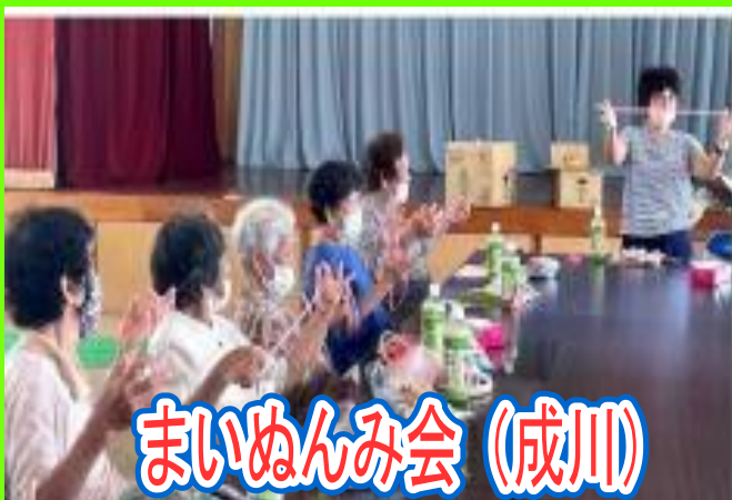
まいぬんみ会(成川)