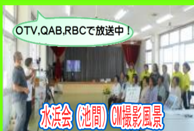
水浜会(池間)CM撮影風景