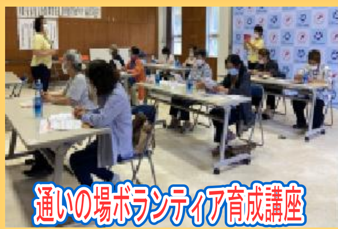
通いの場ボランティア育成講座

通いの場事業では、地域の皆さんが中心となり「通いの場」「いきいき百歳体操」を行っています。(令和3年8月現在43か所)