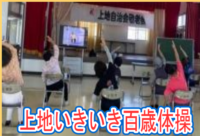
上地いきいき百歳体操